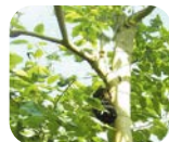
タペグイアイン ペチギノサ 樹皮エキス