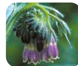
コンフリー葉 エキス