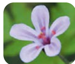
ヒメフウロ エキス